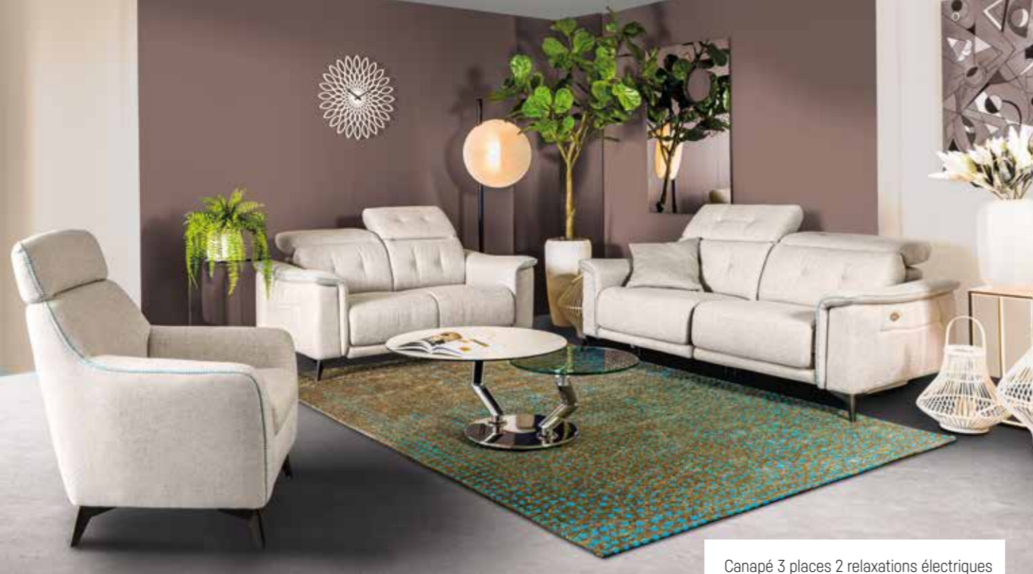
Canapé 3 places 2 relaxations électriques