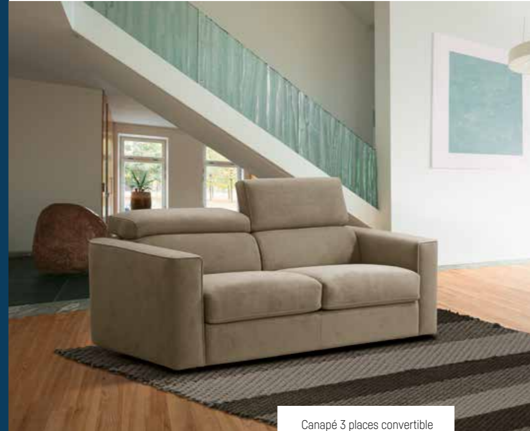
Canapé 3 places convertible