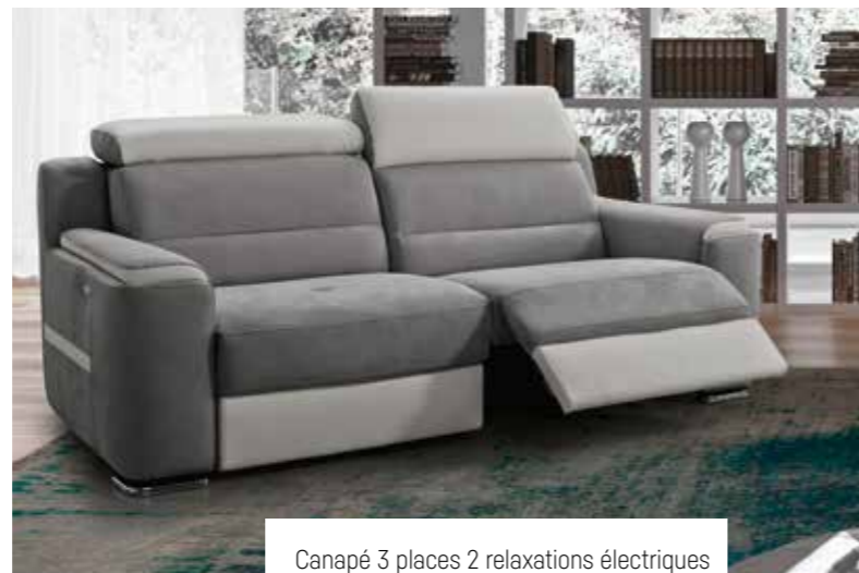
Canapé 3 places 2 relaxations électriques