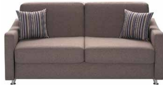
Canapé 3 places convertible

ou 10 mois x110€ Le canapé à 1430€ Après un apport de 330€, montant total dû 1100€. TAEG fixe 0%. Coût total de l'achat à crédit 1430€ Voir conditions page 2.