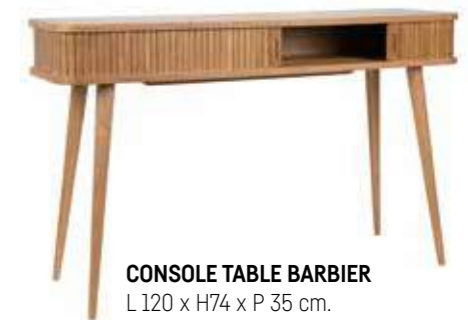
CONSOLE TABLE BARBIER L 120 x H74 x P 35 cm.