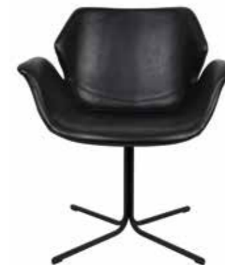
FAUTEUIL NIKKI L79 x H78 x P75 cm