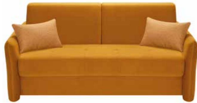
Canapé 3 places convertible