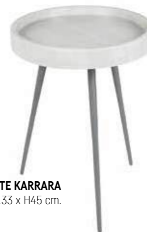
SELLETTE KARRARA L33 x H45 cm.