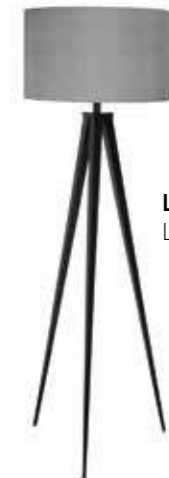
LAMPADAIRE TRIPOD L50 x H157 cm