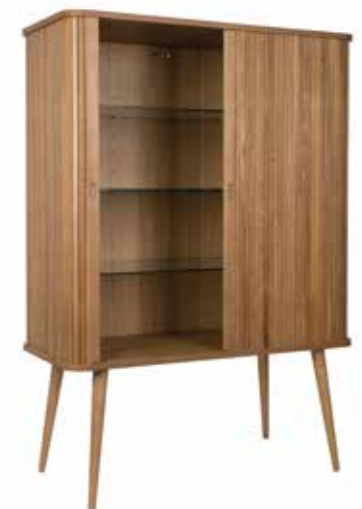
ARMOIRETTE BARBIER Frêne massif et panneaux de particules plaqués frêne. Étagères en verre trempé 6 mm. Portes coulissantes. Vernis polyuréthane. L100 x H140 x P45 cm. 992€ dont Eco-Part 3€