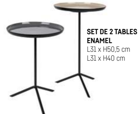
SET DE 2 TABLES ENAMEL L31 x H50,5 cm L31 x H40 cm