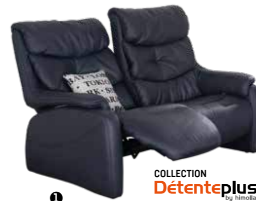
COLLECTION Détenteplus by himolla