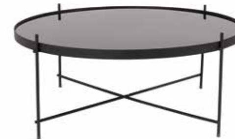
TABLE BASSE XXL CUPID NOIRE L82 x H35 cm